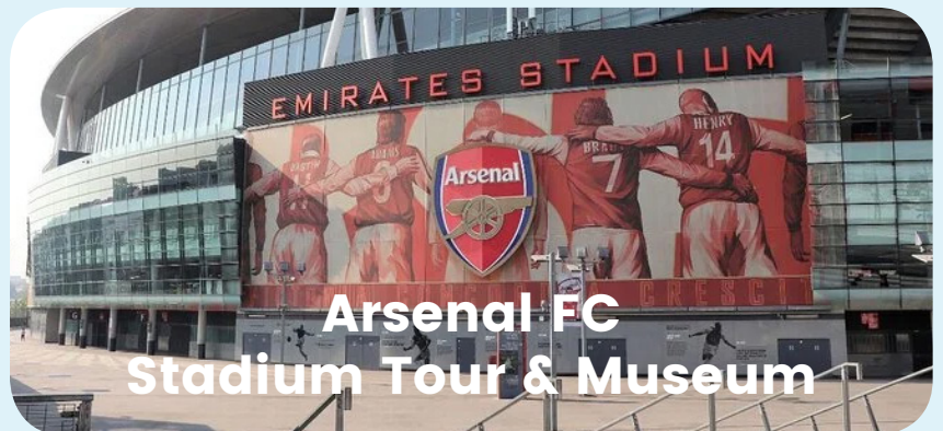
Arsenal FC Stadium Tour & Museum